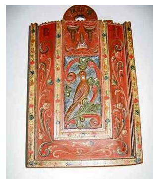
Boven: walmbol met windvaan afkomstig van de lichthuiskeopel op vuurtoren De Brandaris. Onder: een rijksversierde houten schooltas uit Hindeloopen.

straks ook deelnemen aan museum.frl/collectie .